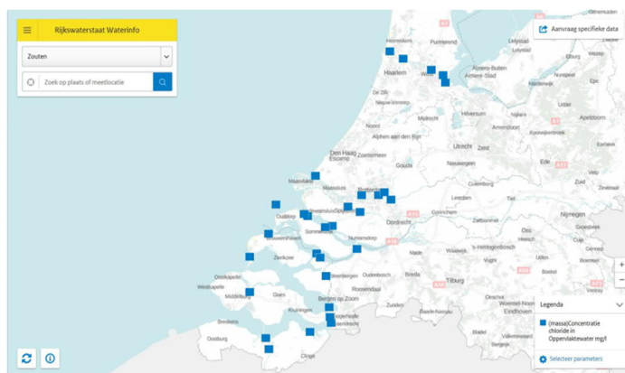
Figuur 3 Via https://waterinfo.rws.nl/#!/kaart/zouten/ is openbaar zoutgehalte uit te lezen

Zoutgehalte of saliniteit van water wordt afgeleid uit geleidendheid en temperatuur. Vandaar dat de zogenoemde CT sensoren (Conductivity & Temperature) het zoutgehalte kunnen meten.