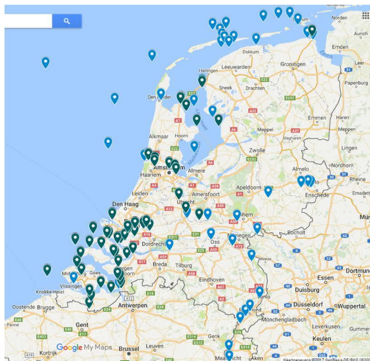
Figuur 2 Kaart met LMW zoutmeetpunten